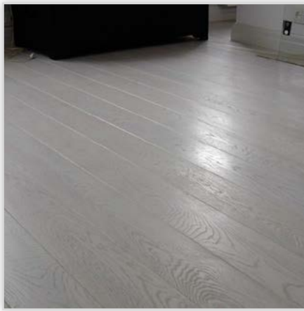
Deska podłogowa dębowa

Elementy uzupełniające: poręcze, tralki, pogrubienia wg zamówienia.