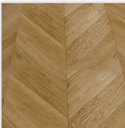
Wzór jodły francuskiej (kąt 45°)

Na indywidualne zamówienie wykonywany z deszczułki dębowej.