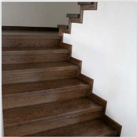
Schody klejone na beton dębowe lub jesionowe

Elementy uzupełniające: poręcze, tralki, pogrubienia wg zamówienia.