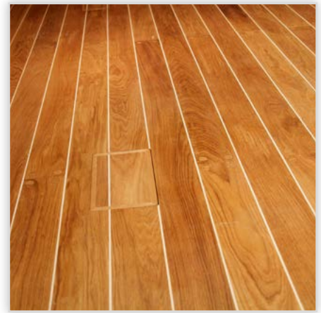
Deska podłogowa dębowa ze wstęgą

Wymiary (szer./dł./gr.) [mm]: (90-220)/(600-2400)/(21 lub 15). Wykończenie: bielenie.